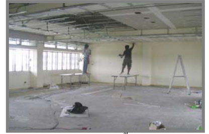
ห้อง 1282 ในขณะนี้กำลังตบแต่ง

อ.เพ่ง วตินวงศ์สว่าง แจ้งว่าจากการที่ มรภ.กพ. มอบให้ งานอาคารสถานที่ ทำการ ออกแบบตบแต่งภายใน ห้อง 1282 อาคาร 12 เพื่อใช้เป็นห้องสำหรับการ เรียนการสอนนักศึกษา ระดับปริญญาเอกนั้น