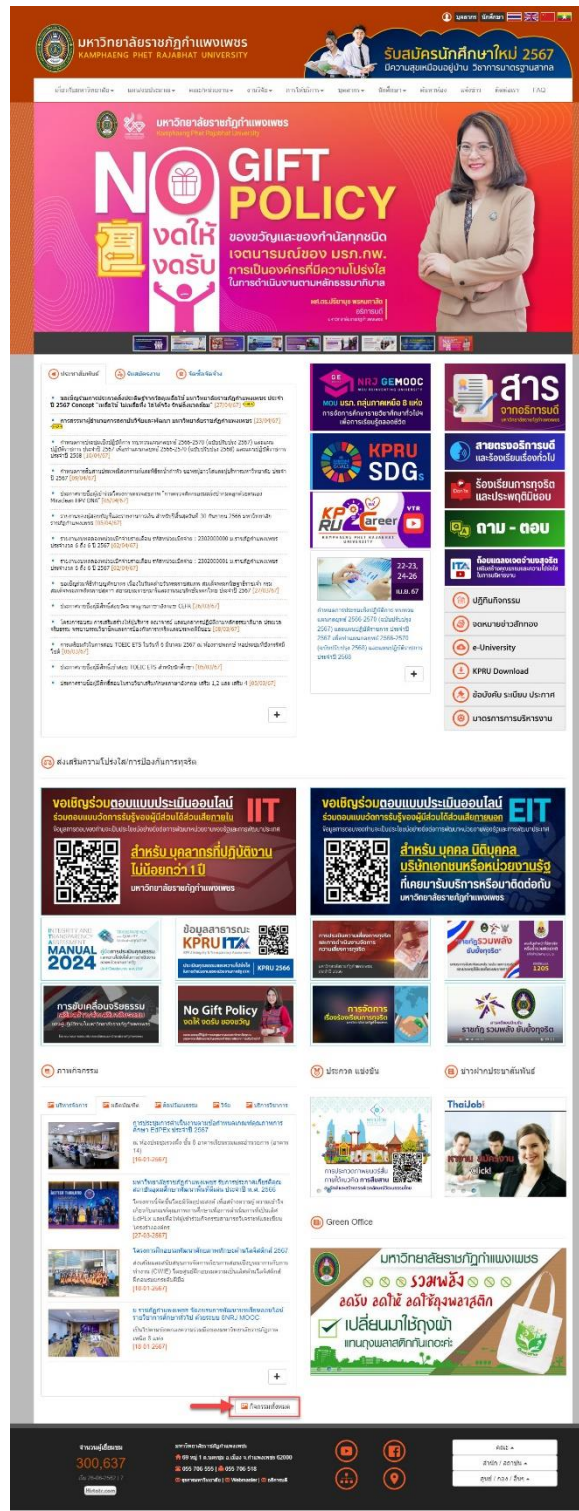
ภาพที่ 1 แสดงหน้าหลักเว็บไซต์มหาวิทยาลัยราชภัฏกำแพงเพชร

โดยเข้าผ่านเว็บไซต์หลักของมหาวิทยาลัย URL: https://www.kpru.ac.th/ สำหรับภาพกิจกรรมของมหาวิทยาลัย มีประชาสัมพันธ์อยู่ใน หน้าหลักเว็บไซต์มหาวิทยาลัย ราชภัฏกำแพงเพชร ดังภาพที่ 1 เมื่อคลิกภาพกิจกรรมทั้งหมด จะปรากฏหน้าต่างภาพกิจกรรม ทั้ง 6 ด้านของมหาวิทยาลัย